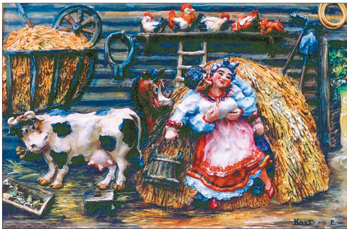
«Як кум до куми залицявся»