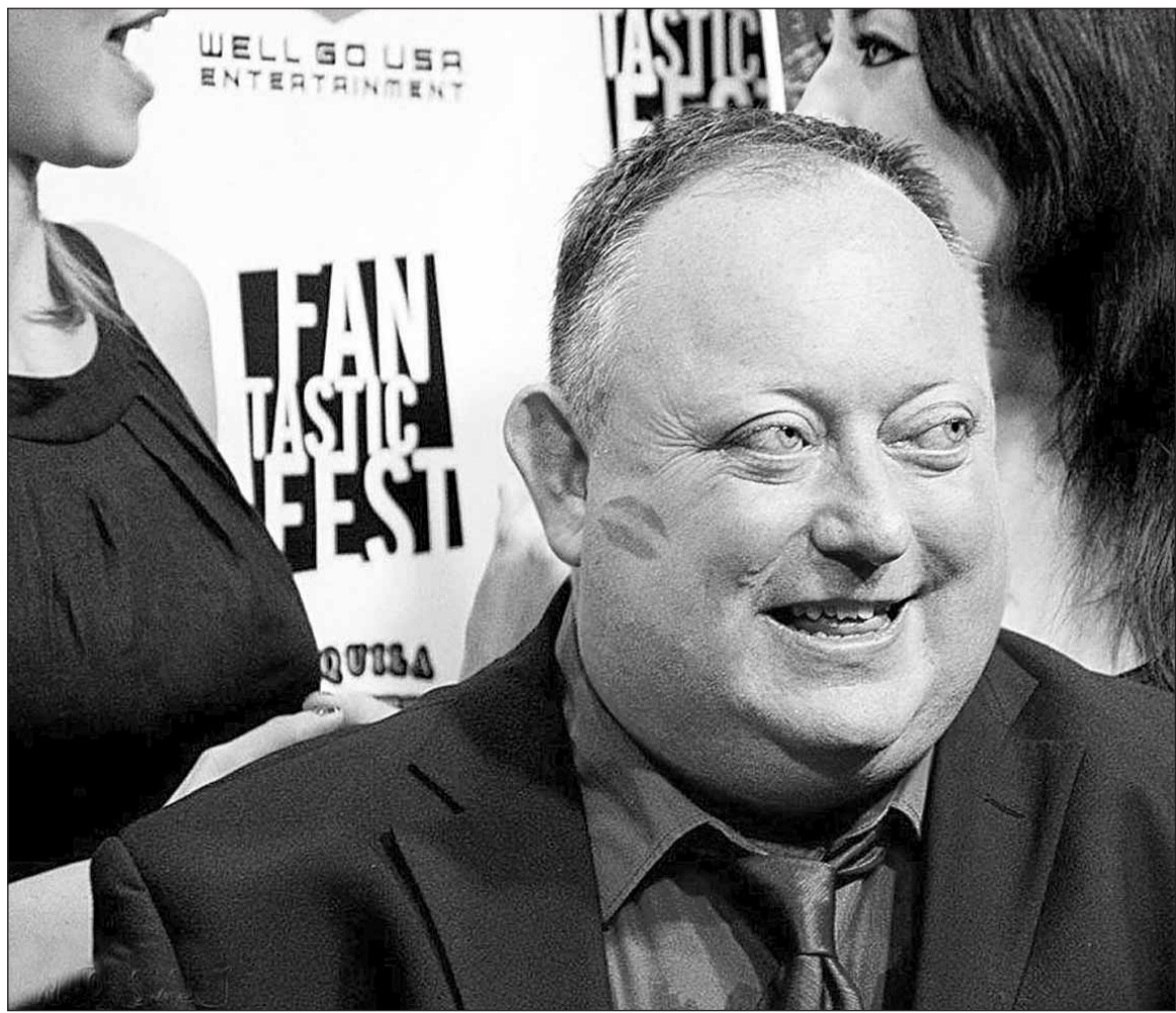
Главный герой фильма — хирург-экспериментатор

О ходе этого предновогоднего действия написано много, и добавит что-то новое трудно. Тем не менее, отметим три наиболее глубоких, на наш взгляд, публикации: «Чат на Болотной площадке» 3 безукоризненно